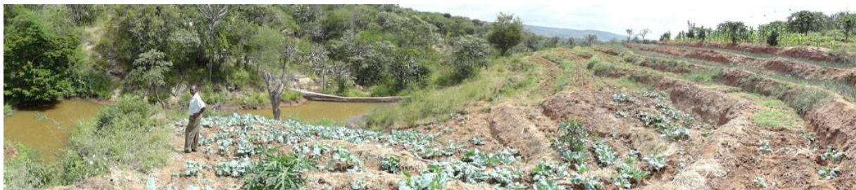
Foto: Voorbeeld van de opvang van water met een (sub)surface dam in een seizoensrivier, waarbij de mogelijkheid is ontstaan om groentes te verbouwen met behulp van irrigatie.

Inmiddels is tijdens het opstellen van het jaarverslag in maart 2015 door Liberty een positief besluit genomen voor de toekenning van een gift van 18.260 euro voor het Ikalaasa project. Meer informatie wordt op de website www.agrinextlevel.nl gegeven.