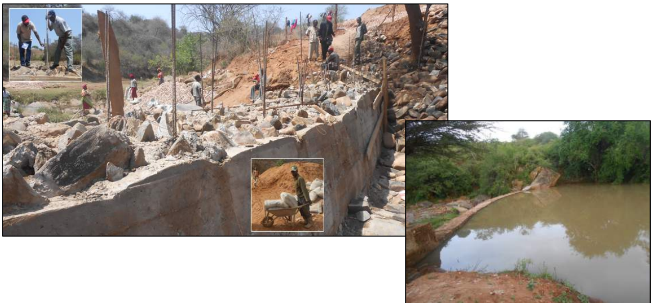
Afbeelding 2: Subsurface dam in aanbouw nabij Kaani (september 2017), waarna deze volstroomde tijdens de regens in november. Er is daardoor een meer van 250 meter lang ontstaan!

Voor meer informatie over bovengenoemde project zie de website www.agrinextlevel.nl . Op onze website kunt u ook een 'StoryMap' bekijken over wateropvang in seizoensrivieren (of gebruik deze link: https://arcg.is/1DPi9 ).