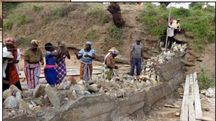
Afbeelding 4: Twee dammen gebouwd door de lokale gemeenschap van Kikaso (december 2017).